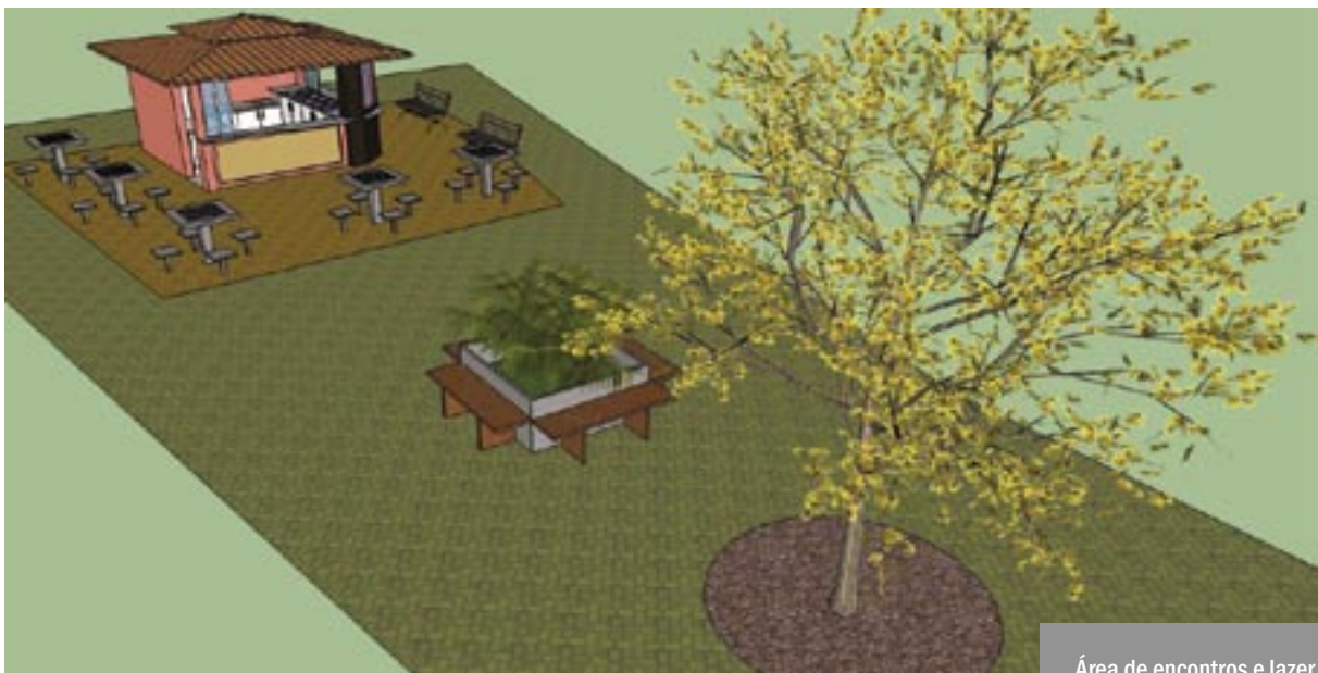
Área de encontros e lazer.