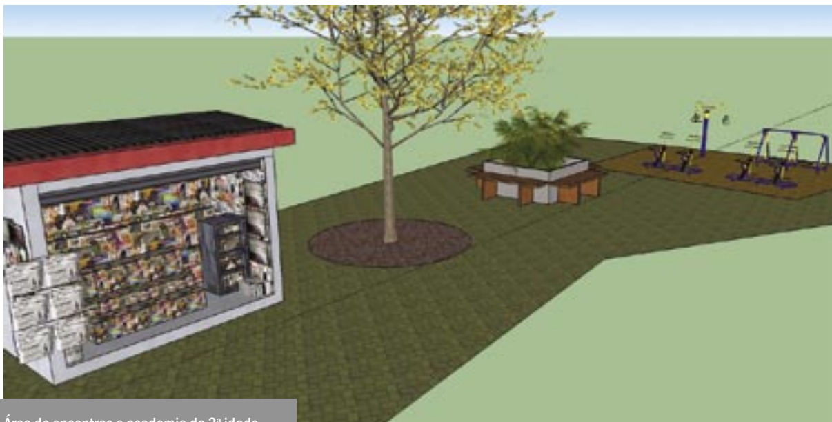
Área de encontros e academia da 3ª idade.

comunidade e elaborar faixas de apoio à comunidade, tendo por objetivo recolher o apoio dos movimentos populares, das organizações de defesa dos direitos humanos e dos moradores dos bairros vizinhos.