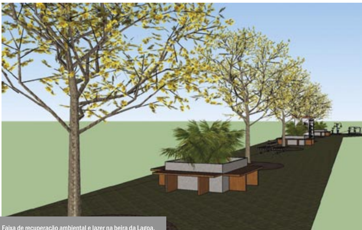
Faixa de recuperação ambiental e lazer na beira da Lagoa.

Nas oficinas, os moradores relataram casos de alagamentos provocados pela abertura de buracos nos muros do Autódromo, através dos quais se escoava a água da chuva para a Avenida Autódromo. Nos levantamentos domiciliares foram relatadas situações de alagamento, especialmente nas ruas Francisco Landi (cujo traçado sinuoso dificulta ainda mais o escoamento das águas da chuva), Travessa Graham Hill e ruas François Cevert, Nelson Piquet e Gilles Villeneuve, abrangendo áreas onde geralmente a cota é inferior a 1,0 metro.